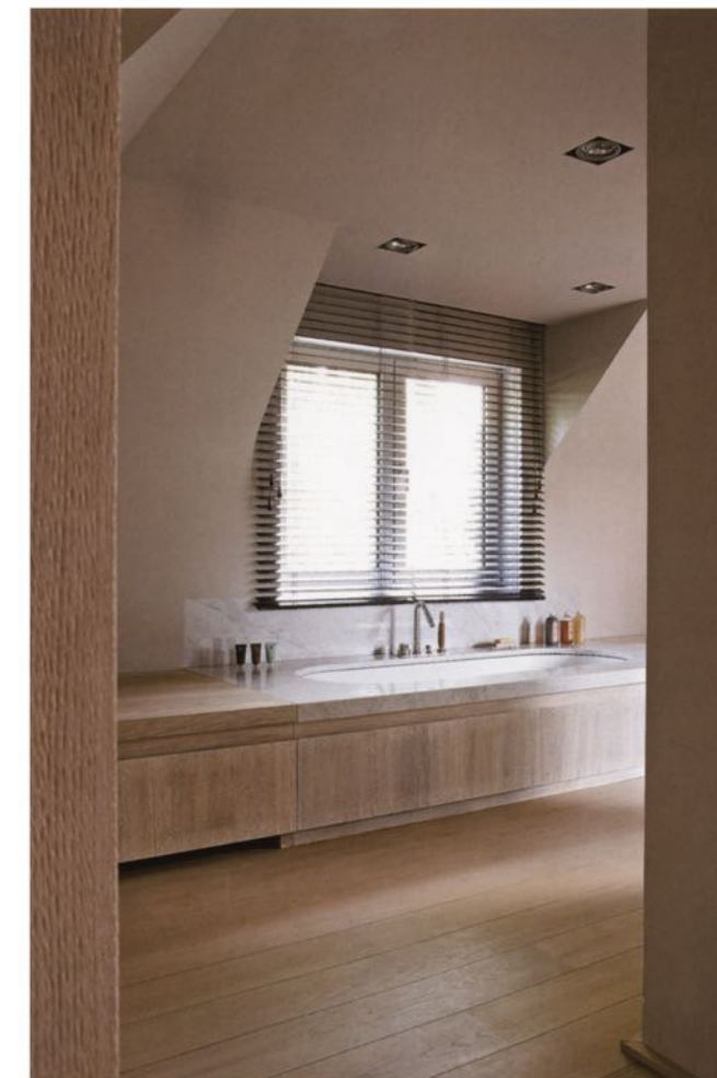
Washstand and bath surrounds in white Carrara marble. Taps by Boffi .