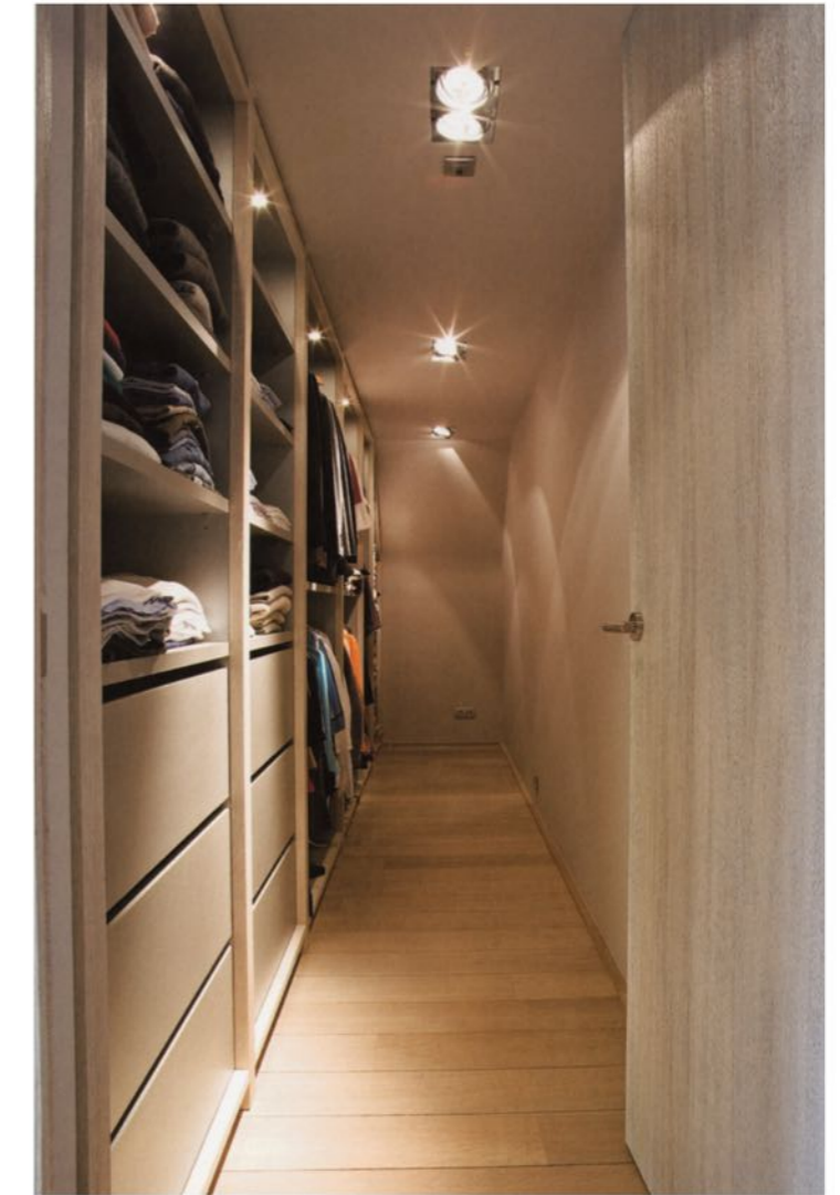
Harmony of sandblasted tinted oak in the bedroom and dressing room. An MDF "Lim" bed.