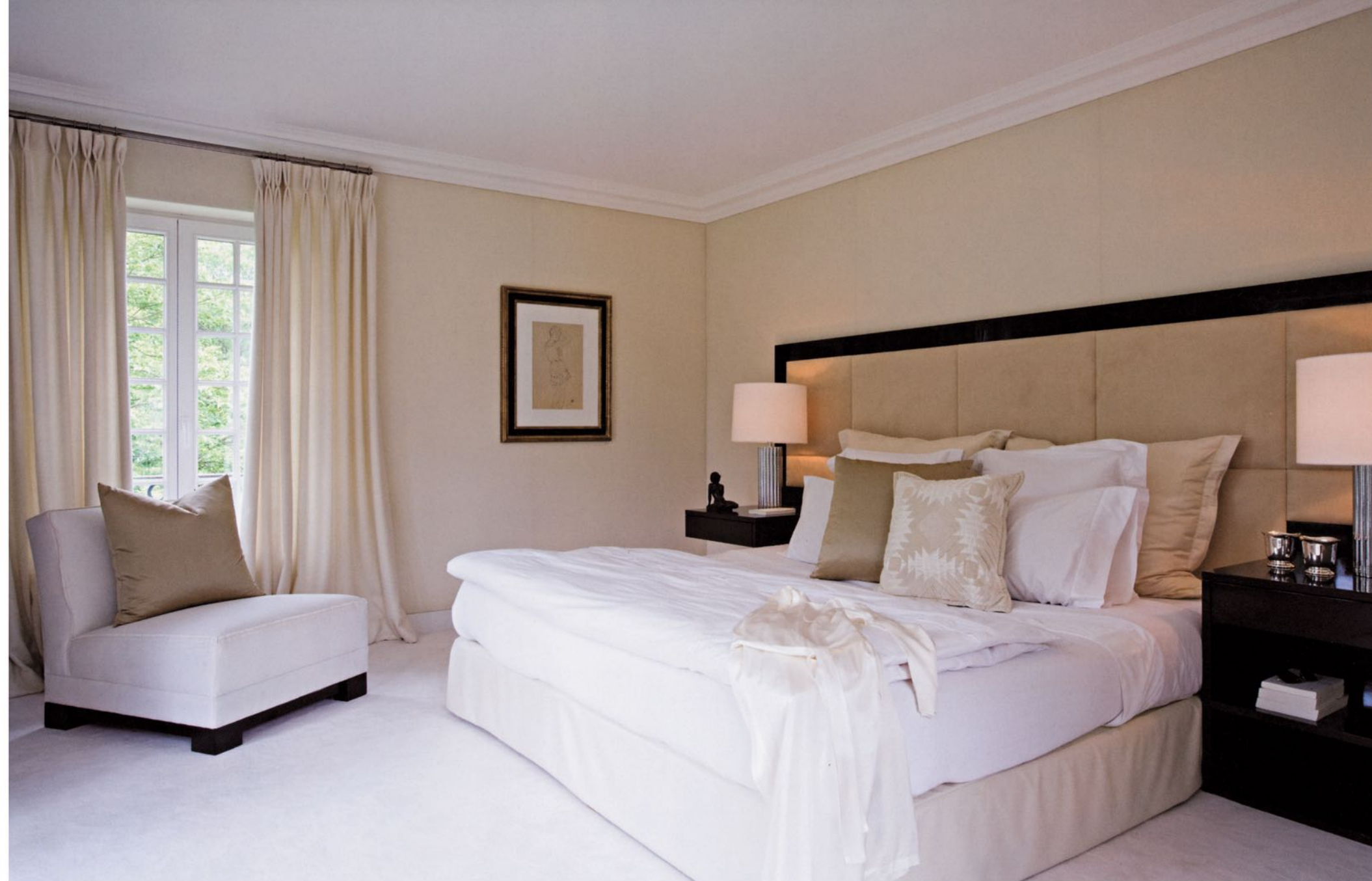
An armchair and accessories by Ralph Lauren in this bedroom.