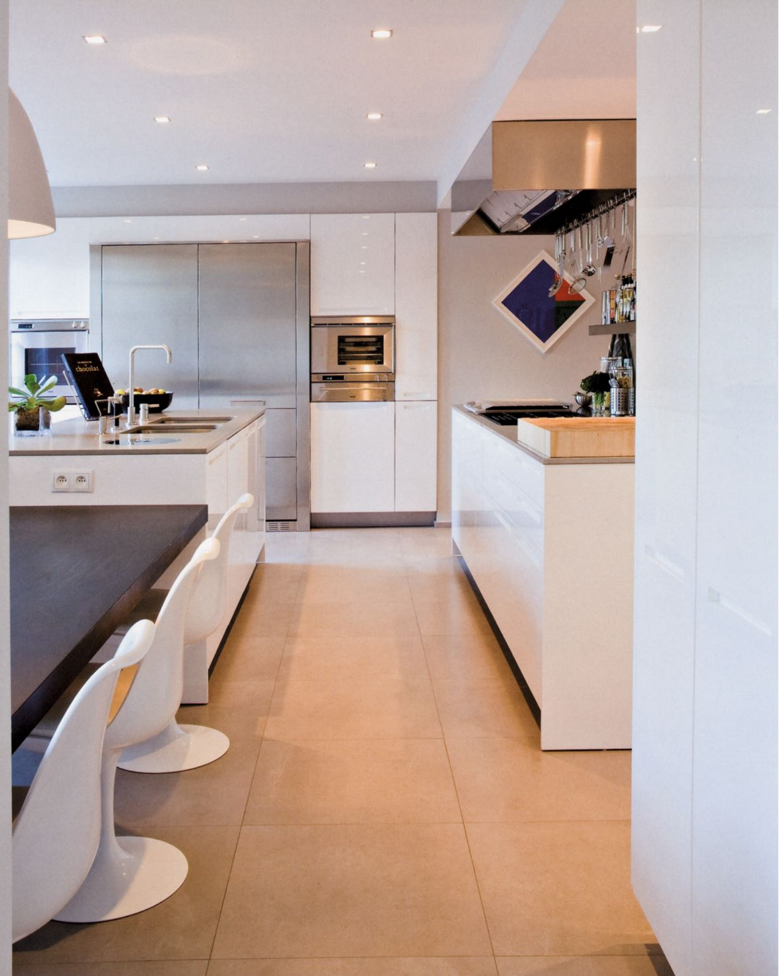
"Tulip" chairs for the dining area in this spacious kitchen.

Chaises "tulipes" pour le coin repas de cette cuisine spacieuse.